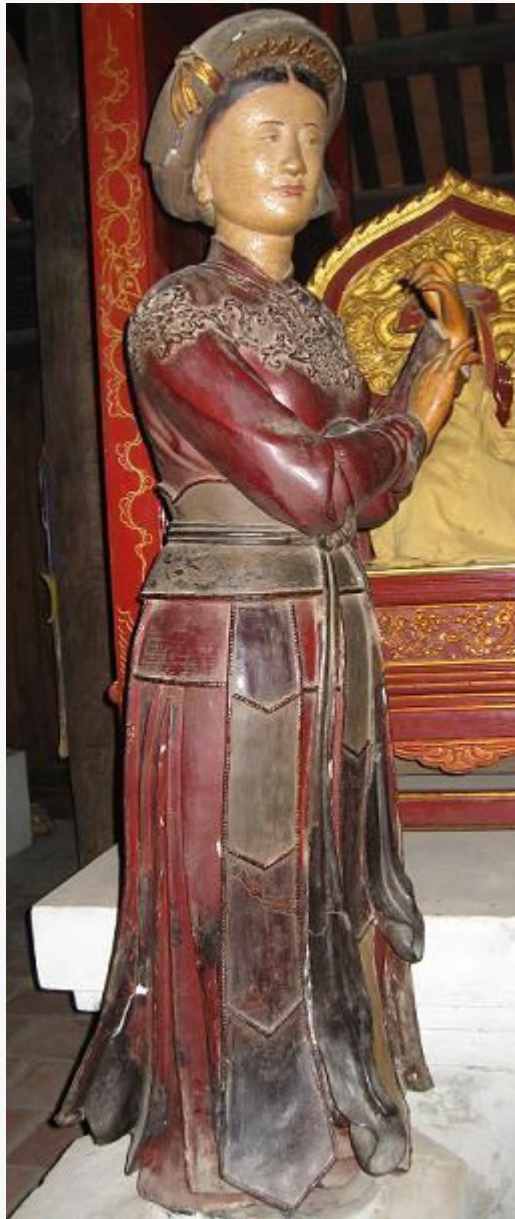
Tượng Ngọc Nữ thế kỷ 17

được sử dụng khá nhiều ở nông thôn miền Bắc cho đến những năm đầu thập niên 1930.